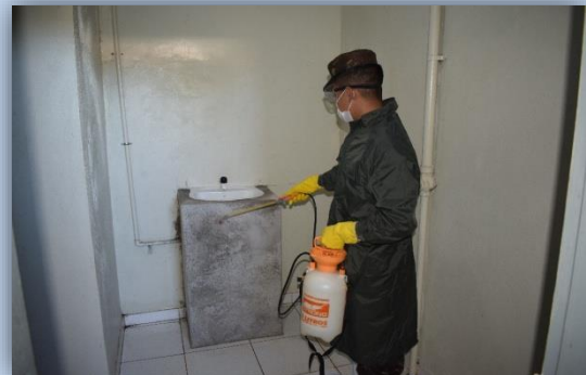
Instalações do Corpo da Guarda