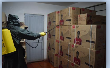
Secretaria de Educação