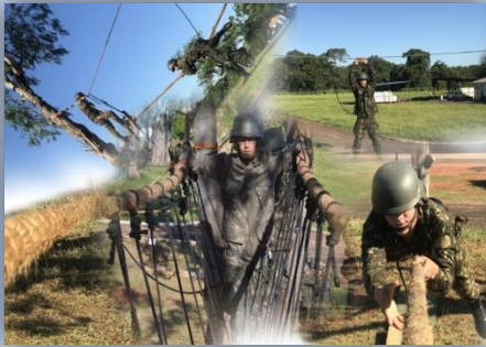
Transposição de Obstáculos

As instruções tiveram como referência o Programa Padrão do Período Básico e, ao final da fase, os instruídos colocaram todos os ensinamentos em prática na 1ª Semana Verde, executada no mês de junho, no campo de instrução da Organização Militar (OM).