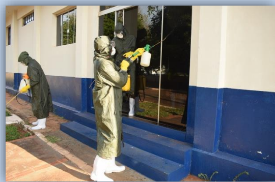
Auditório do Grupo