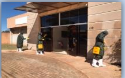
Unidade Básica de Saúde