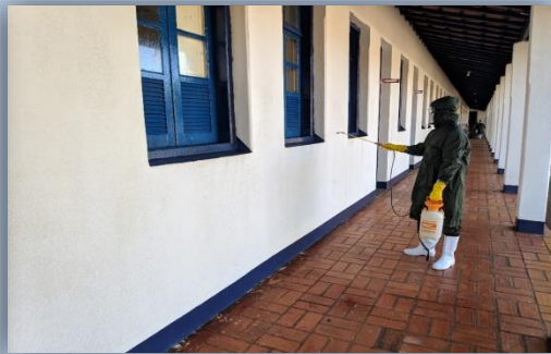
Áreas internas e externas das SU