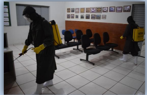
Seção de Saúde