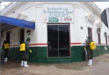
Secretaria de Assistência Social