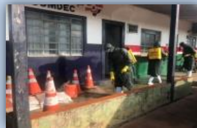
Secretaria de Obras