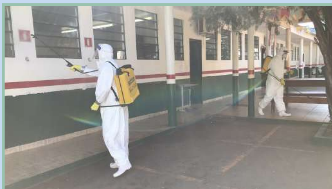
Colégio Guilherme Corrêa - Nioaque/MS