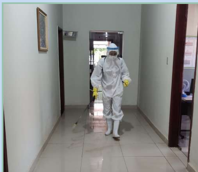
Pavilhão de Comando