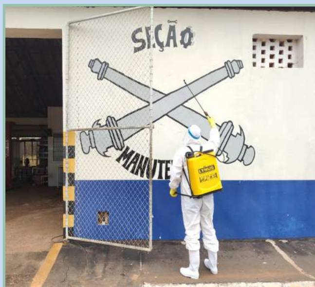
Seção de Manutenção