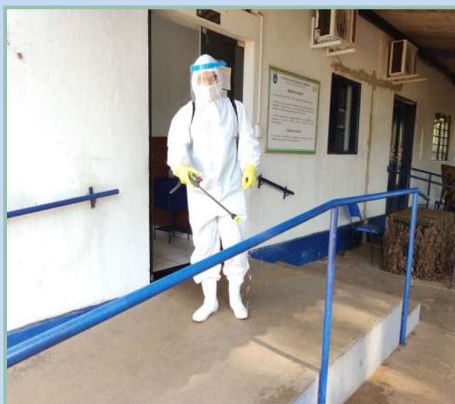
Seção de Saúde