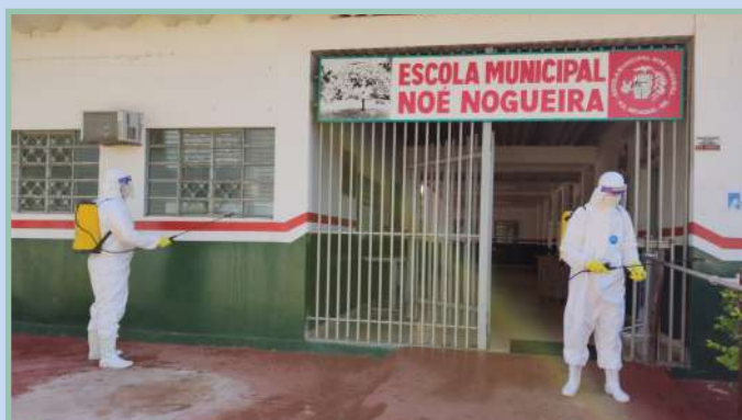
Escola Municipal Noé Nogueira - Nioaque/MS