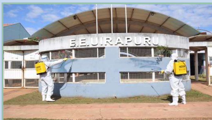
Escola Estadual Uirapuru - Nioaque/MS